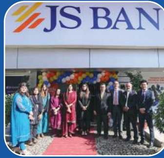
Block 2, Clifton