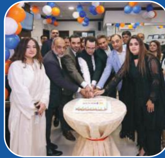
Phase 4, DHA