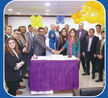
Delhi Mercantile Society