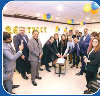
26th Street, DHA