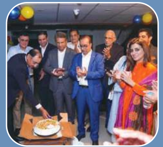
T Block, DHA Phase 2